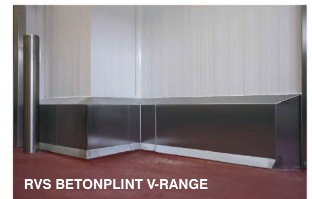
RVS BETONPLINT V-RANGE