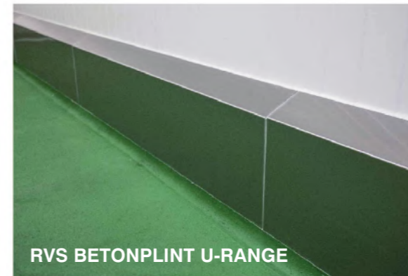
RVS BETONPLINT U-RANGE